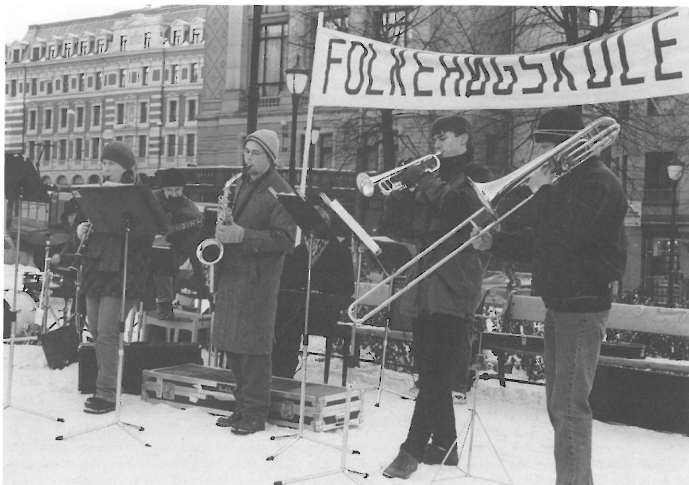
Folkehøgskolen ga rom til å leve. Folkehøgskolen var kanskje det året mange husker best.

dag eit løft, ei utfordring til å leggja eit godt grunnlag vidare. Regjeringa har den spesielle og viktige oppgåva som no ligg i å ta dei klare signala som i dag er gitt, og fylgja opp frå si side på ein langt meir positiv måte enn det ein til no har sett frå departementet.