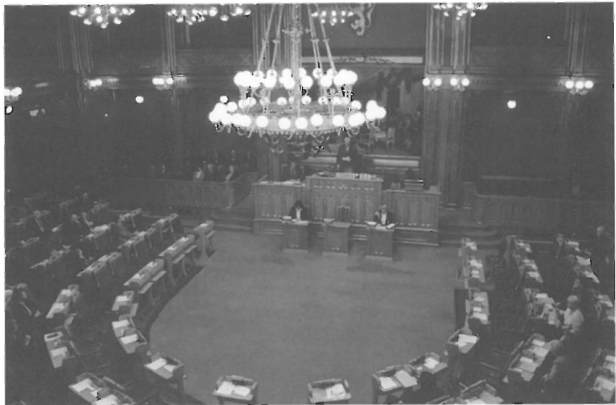
Folkehøgskolen drøftes i Stortinget.

teens flertall har det vært avgjørende for utfallet i behandlingen av denne saken at folkehøgskolen fremdeles skal være en selvstendig, ubundet og eksamensfri skole. Her vil jeg få understreke essensen i folkehøgskolens idé: Tilegning av folkelige forbilder og erfaringer, hverdagsmenneskenes kyndighet og ytelser i en pensumfri og eksamensfri skole, der hver skole kan ha sine egne særtrekk.