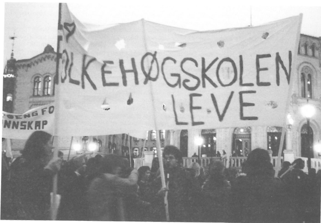
Folkehøgskolen er minst like nødvendig i dag som da den første folkehøgskulen vart opna for drygt 132 år sidan.

len – den dagen la Regjeringa fram St. meld. nr. 51 for 1995-1996. Men så skjedde det utmerkte at elevar og lærarar og andre som ville forsvare og utvikle folkehøgskulen, tok utfordringa frå arbeidarparti-regjeringa og mobiliserte til ein brei kamp for å forsvare den skuleforma og dei verdiane som folkehøgskulen representerer.