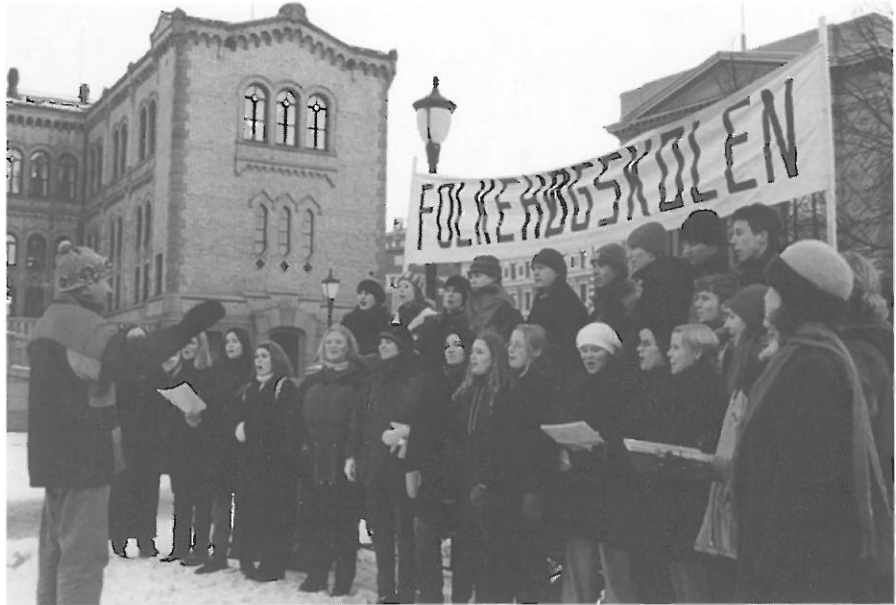
Folkehøgskolens brede engasjement har gjort inntrykk på KUF-komiteen.